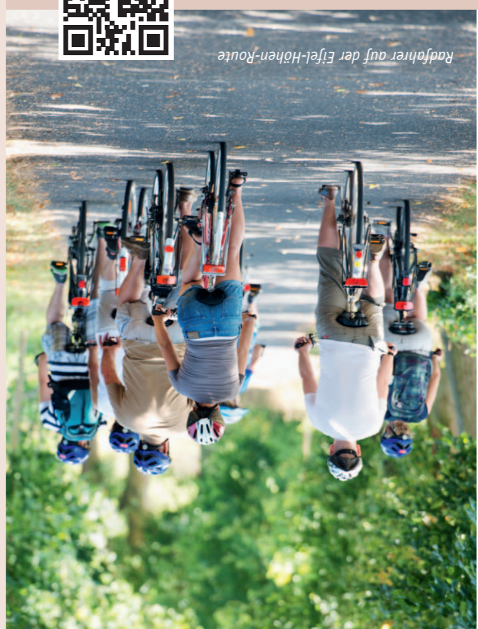
Radfahrer auf der Eifel-Höhen-Route

Natur-Erleben rund um den Nationalpark Eifel Die Route führt Sie durch die majestätischen Buchenwälder des Nationalparks Eifel, idyllische Natur und zu atemberaubenden Panoramaaussichten. Nebenbei werden Sie die verschiedenen Sehenswürdigkeiten der Region kennenlernen: Seien es römische Relikte, historische Örtchen und Städte, Wildgehege, Besucherbergwerke, Museen, Klöster sowie Burgen und Schlösser. Durch die Nähe zur Bahnstrecke Köln-Trier sowie zur Kurttalbahn ist der Einstieg in die Route individuell und nahezu überall möglich.