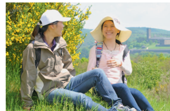
Blick auf vogelsang ip