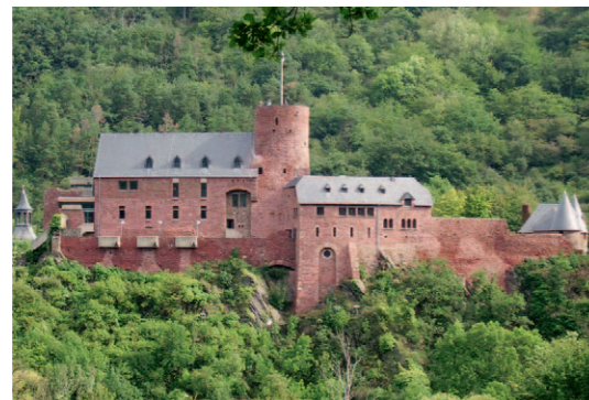
Burg Hengebach, Heimbach