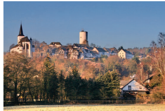
Blick auf Hellenthal-Reifferscheid

Noch geht es bergab zu den Funden der Römischen Wasserleitung, doch der Anstieg zur Kakushöhle bei Eiserfey bis nach Keldenich lässt nicht lange auf sich warten. Weiter führt die Route bergab nach Urft. Von hier lohnt sich ein Abstecher zum Kloster Steinfeld mit Basilika, durch das Urfttal, vorbei an der römischen Brunnenstube „Grüner Pütz“ zum Naturzentrum Eifel nach Nettersheim, bevor man zurück zum Ausgangspunkt Blankenheim gelangt. Hier kann man über den Ahradweg bis zum Rhein oder über den Kylltalradweg bis nach Trier weiter radeln.