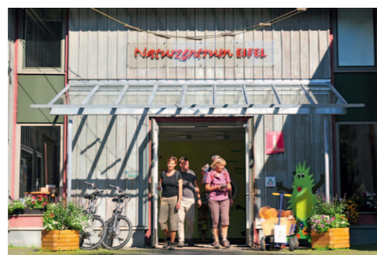
Naturzentrum Eifel, Nettersheim