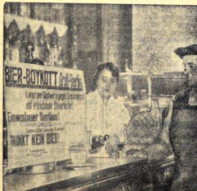
Die Bierhölzer ohne Bier. Das Plakat am Scheinisch ruft zum Bierboycott auf

der jetzt in Italien ausprobiert wurde. Er läuft auf 10 Gummirädern und vermag eine Geschwindigkeit von 80 Kilometern zu erzielen. Von dem neuen Fahrzeug erhofft man eine wirtschaftlichere Ausnutzung wenig befahrener Bahnhöfen und schnellere Fahrzeiten auf Bergstrecken.