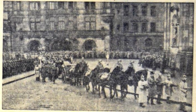
Der feierliche Ehrenkondukt auf dem Wege zur Hofkirche