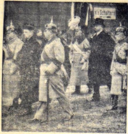
Aus dem Trauergesolge: In der ersten Reihe die Söhne Friedrich Augusts. In der zweiten Reihe links Rupprecht von Bayern.