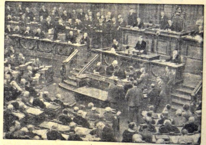
Der Reichstag (Groener spricht)