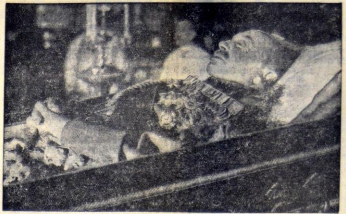
Friedrich August III. auf dem Totenbett.