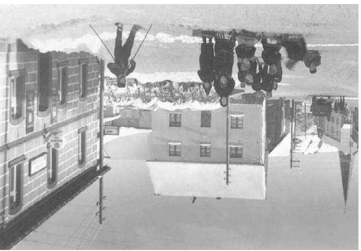
Der Ort Wollseifen vor Gründung des Truppenübungsplatzes.

Barrierefreie Angebote Die barrierefrei gestaltete Internetseite www.nationalpark-eifel.de gibt umfangreiche Informationen über die Naturerlebnisangebote im Nationalpark Eifel sowie deren Eignung für Menschen mit und ohne Behinderungen. Darüber hinaus bündelt die Internetseite www.eifel-barrierefrei.de des Deutsch-Belgischen Nationalparks Hohes Venn-Eifel die barrierefreien Angebote der gesamten Region.