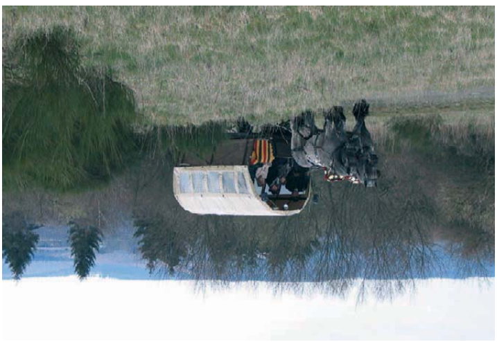
Von April bis Oktober pendeln jeden ersten und dritten Sonntag im Monat rollstuhlgerechte Kutschen zwischen Vogelsang, Walberhof und Wollseifen.

Natur erleben An der Seite von Profis Mehrmals wöchentlich bieten die Ranger der Nationalparkverwaltung geführte Touren an. Mit ihren authentischen Erfahrungen und Geschichten führen sie auf Routen unterschiedlicher Länge und Schwierigkeit durch das Großschutzgebiet. Für Schulklassen, Kinder- und Jugendgruppen gibt es vielfältige Programme zur Umweltbildung. Zahlreiche barrierefreie Angebote machen das Großschutzgebiet dabei für alle erlebbar. Den kostenlosen Nationalpark-Veranstatungskeiender mit jährlich rund 600 Angeboten erhalten Sie unter www.nationalpark-eifel.de oder beim Nationalparkforstamt Eifel.