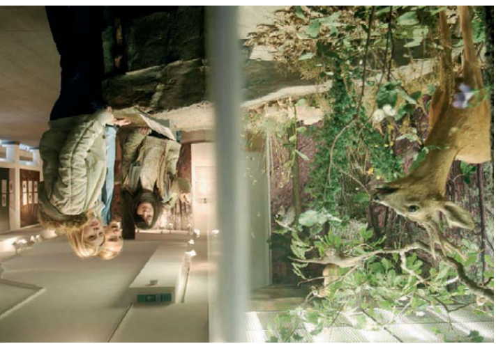
Die Nationalpark-Tore bieten abwechslungsreiche Ausstellungen für Jung und Alt.

Nationalpark-Tor Gemünd Knorrige Eichen, bunte Spechte und spannende Waldgeschicht(e)n erleben Sie im Nationalpark-Tor Gemünd im Haus des Gastes. Die Ausstellung beleuchtet die Besonderheiten der unmittelbaren Umgebung des Tores. Dazu gehören Eichenwälder mit ihren besonderen Tieren und Pflanzen sowie die spannende Geschichte der Waldnutzung durch den Menschen.