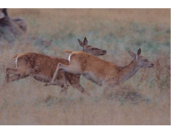
Rotwild auf der Dreiborner Hochfläche.

Vielfalt von Nord bis Süd Im Nationalpark Eifel findet die Natur Zeit und Raum für eine freie Entfaltung. Ehemals wirtschaftlich genutzte Wälder und von Menschenhand gestaltete Landschaften finden in ihr natürliches Eigenleben zurück. Unter dem Motto „Natur Natur sein lassen“ verzichtet der Mensch auf die Nutzung von Holz, Früchten und anderen Naturgütern.