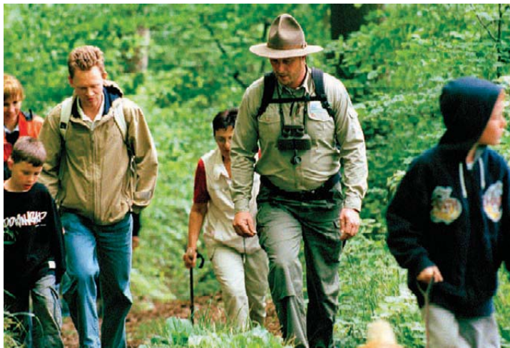
Begleiten Sie die Ranger und Waldführer des Nationalparks bei ihren Touren.