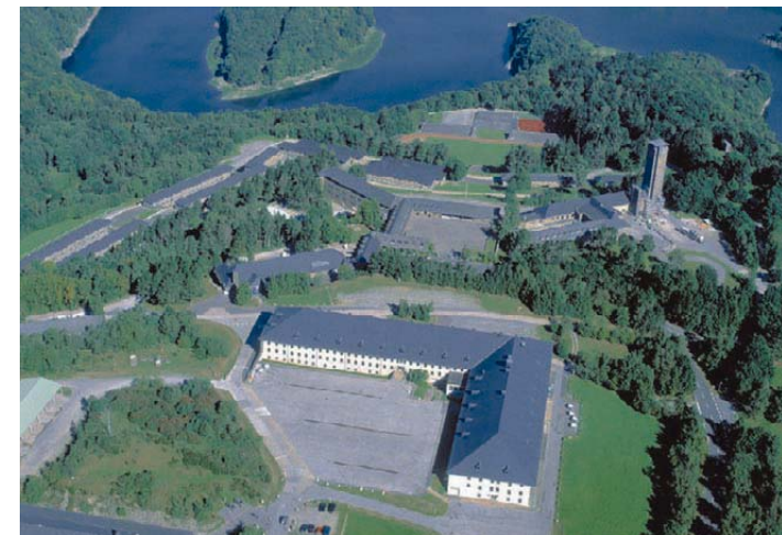
Der bebauter Bereich Vogelsang oberhalb des Urftsees.