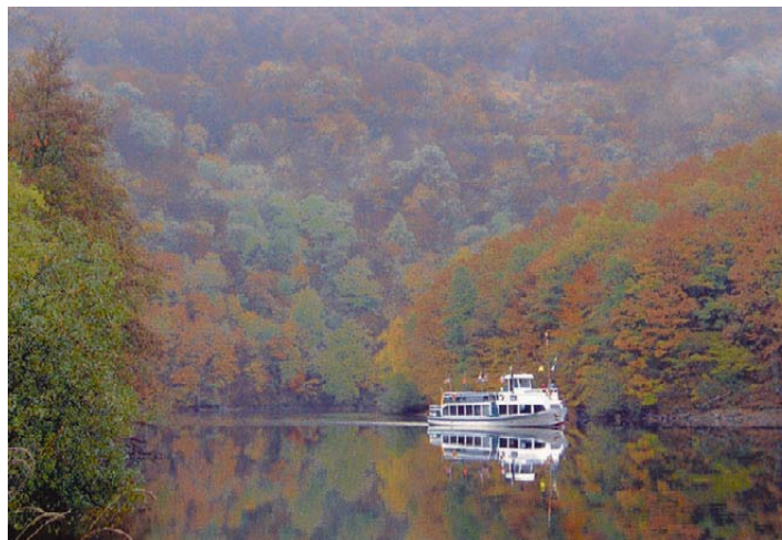
Wanderungen im Nationalpark Eifel lassen sich gut mit Schiffstouren auf dem Rur- oder Obersee kombinieren.